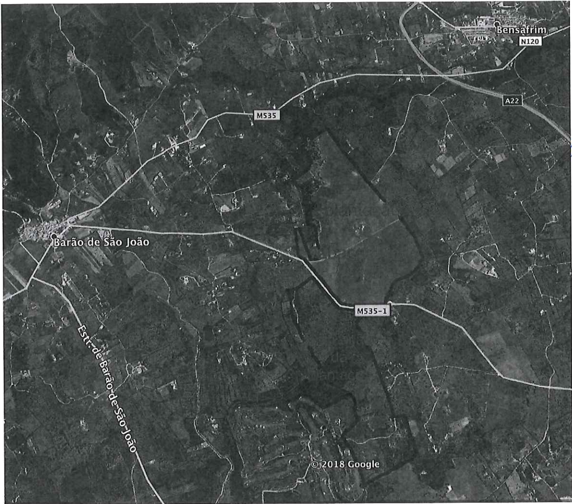
Mapa de localização da plantação de 76ha e do projecto de expansão de 50ha